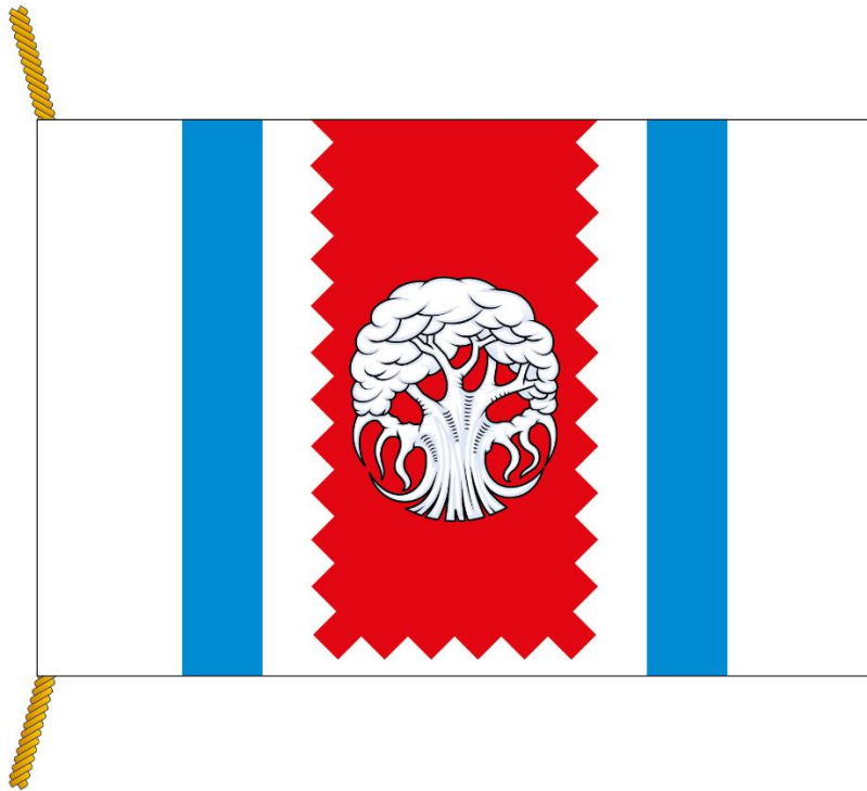
РИСУНОК ФЛАГА МУНИЦИПАЛЬНОГО ОКРУГА ЗАПАДНОЕ ДЕГУНИНО (лицевая сторона)